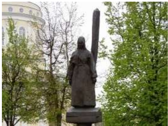
Леди Макбет Мценского Уезда