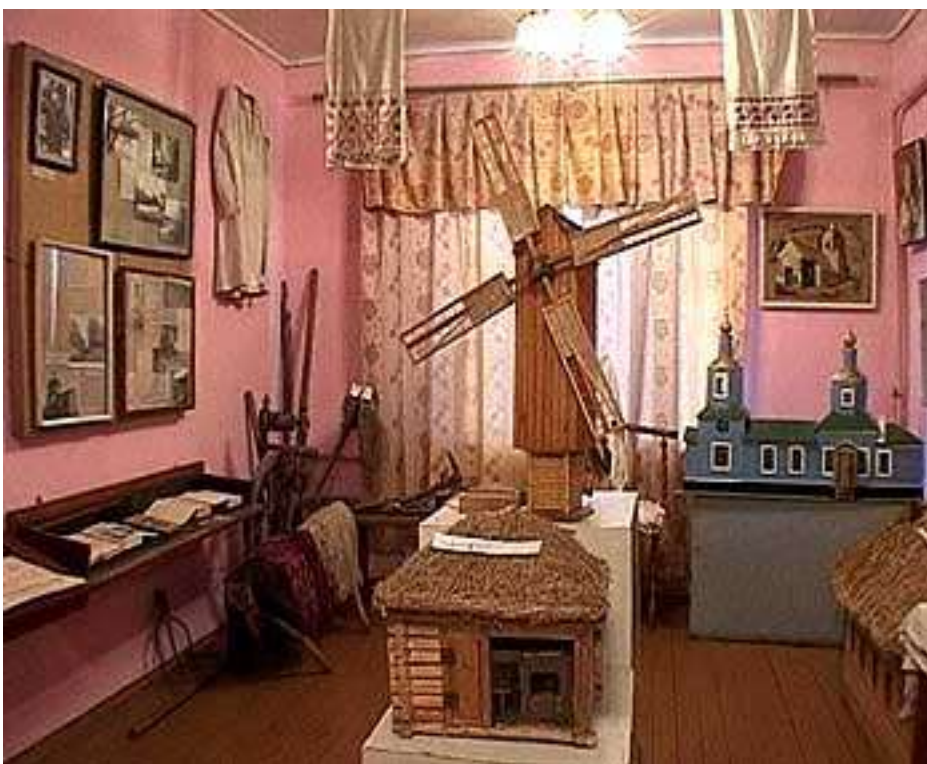
Литературно- мемориальная композиция «Мир Лескова»

В 1975 году, к 80-летию со дня смерти писателя, в селе Гостомль под Кромами, где прошли детские годы Лескова, в местной школе, носящей его имя, была открыта комната-музей